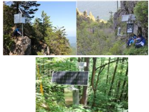
[Test-bed 지역 내 모니터링 시스템 설치]