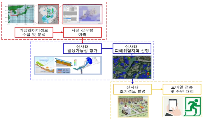
[산사태 조기 경보 시스템 개념도]