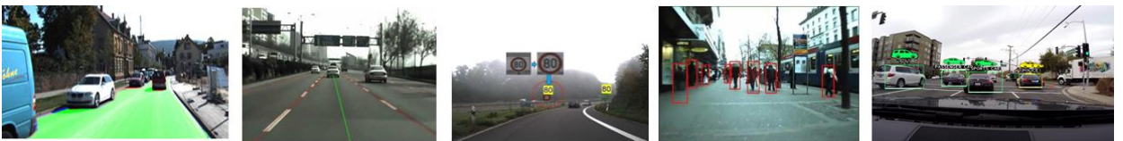
[영상기반 주행환경 인식기술 사례]