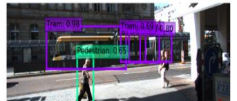
딥러닝 기반 주행환경 내 실시간 객체검출 기술