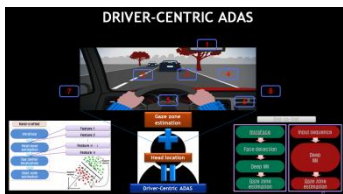
Driver Centric ADAS/ Autonomous Driving을 위한 gaze-zone 인식 기술